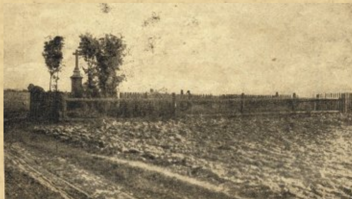
Cmentarz w 1918 r.