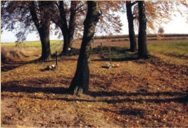
Cmentarz w miejscowości Dzierzkowice-Podwody w 2009 r.