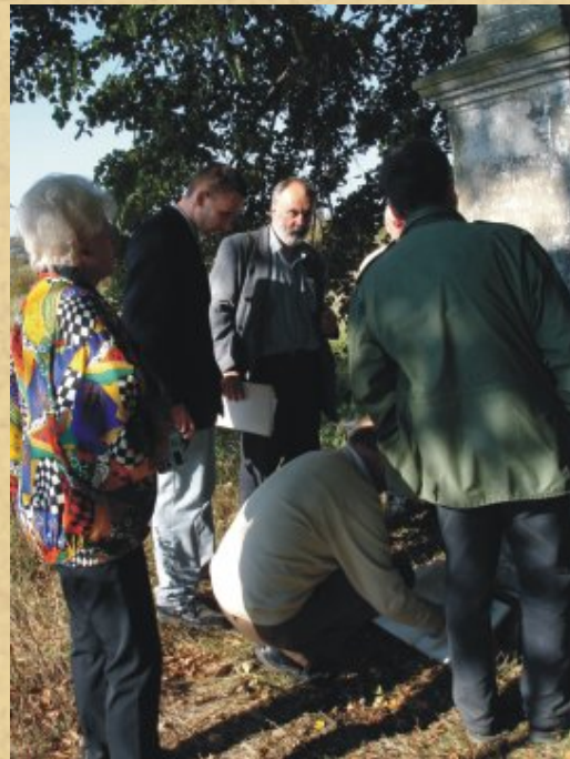
Wizytacja cmentarza z delegacją Austriackiego Czarnego Krzyża (10 października 2006 r.)