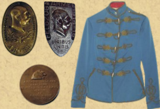
Odnaki pamiątkowe 1. i 4. armii austro-węgierskiej, węgierski medal wybity z okazji walk pod Kraśnikiem oraz kurtka huzara austriackiego