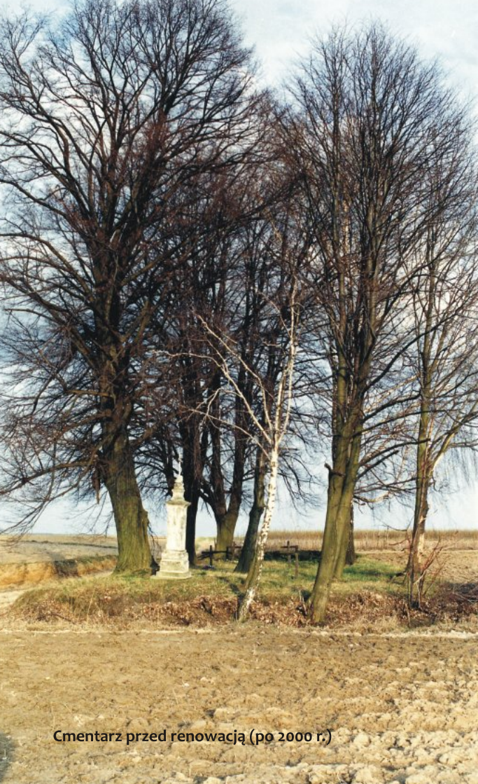
Cmentarz przed renowacją (po 2000 r.)

Cmentarz usytuowany jest w środku pól, pomiędzy wsiami Suchodoły i Dzierzkowice-Podwody, gm. Dzierzkowice przy drodze gruntowej i polnej figurze Matki Boskiej z roku 1910 – 3 km na pld.-zach. od zabudowań wsi Dzierzkowice-Podwody. Z dwóch stron ograniczony jest drogami polnymi, od strony pól słabo wyodrębniony. Rosnąca tu stara lipa i kilka młodszych drzew to właściwie jedyny wyraźny wyróżnik obiektu w terenie.