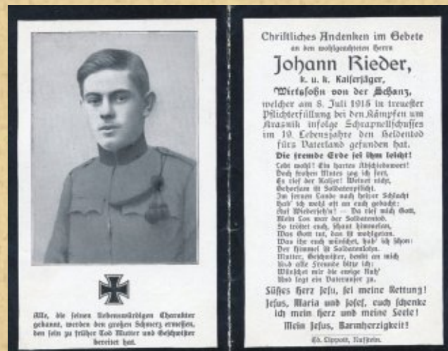
Sterbebild – karta śmierci żołnierza armii austro-węgierskiej

W wykazach z 1925 r. podane są 4 masowe mogiły bez liczby pochowanych. Kilka lat później mówi się już o 4, a następnie o 5 mogiłach masowych. Cmentarz znajdował się na gruncie Józefa Madrasa i miał wymiary 19 × 7 m (powierzchnia 133 m 2 ). Przenoszono tu kolejne, pojedyncze mogiły. Potwierdzeniem tego jest wymieniana w budżecie Urzędu Wojewódzkiego Lubelskiego – Referat Grobownictwa Wojennego kwota 70 zł w roku budżetowym 1931/1932 przeznaczona na komasację okolicznych mogił na to miejsce. Pod koniec lat 20. XX w. cmentarz był już mocno zaniedbany. Według ówczesnych danych miał wymiary 19 × 7,70 m i powierzchnię 146,30 m 2 . W ramach jego uporządkowania, na początku lat 30. zaplanowano wykonanie ogrodzenia z drewna sosnowego składające się z dwóch barier na słupach, wycięcie chwastów na mogiłach ziemnych i podwyższenie ich do wysokości 0,5 m oraz odarniowanie. Całkowity koszt prac renowacyjnych miał wynieść 353,00 zł.