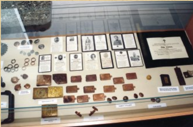
Pamiątki z działań wojennych można oglądać w Muzeum Regionalnym w Kraśniku

W ewidencjach sporządzanych po II wojnie światowej cmentarz wymieniany jest wielokrotnie. W wykazie Prezydium Gromadzkiej Rady Narodowej w Dzierzkowicach-Rynku z 27 października 1955 r. podano, że cmentarz nie jest ogrodzony, znajduje się na gruncie Zofii Madras ze wsi Podwody. Jego wielkość określono na 500 m 2 , a ilość pochowanych osób na około 500 (bez podania narodowości). Z kolei w wykazie PGRN z 8 czerwca 1957 r. podano liczbę 168 poległych żołnierzy, w tym 12 polskich, 38 rosyjskich, 69 austriackich i 49 niemieckich. Trudno stwierdzić na czym oparto te dane, oprócz informacji mieszkańców, brak bowiem do wykazu podstawy źródłowej. Brak jakichkolwiek dowodów, że żołnierzy niemieckich chowano na tym cmentarzu, żołnierzy polskich można interpretować jako polskiego pochodzenia według miejscowości urodzenia lub zamieszkania, co mogło zostać ujawnione podczas ekshumacji. Być może dane te dotyczą kilku razem zestawionych mogił z różnych miejsc.