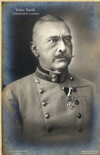
Portret gen. Dankla

Działania wojenne szybko dotarły na pograniczne tereny dzisiejszego powiatu janowskiego i kraśnickiego. W dniach 23–25 sierpnia 1914 r. starły się na ziemi kraśnickiej oddziały 1. armii austro-węgierskiej gen. Viktora Dankla i 4. armii rosyjskiej. W wyniku bitwy określanej jako „Schlacht bei Krasnik” – bitwa pod Kraśnikiem – Rosjanie wycofali się pod Lublin, ale wkrótce przeszli do ofensywy i wyparli Austriaków za San. 12 września weszli do Kraśnika. W lipcu 1915 r. w wyniku nowej ofensywy 4. armia austro-węgierska pod dowództwem arcyksięcia Józefa Ferdynanda Salwatora, wspierana przez 47. niemiecką Dywizję Rezerwową po krwawych walkach pod Kraśnikiem i Urzędowem, na linii Wiśły, Wyżnicy, Urzędówki i Bystrzyca, pokonała oddziały 4. i 3. armii rosyjskiej, które wkrótce opuściły Lublin i Lubelszczyznę. Nad Wyżnicą i pod Urzędowem duży udział w zwycięstwie armii austriackiej miała I Brygada Legionów Polskich. W odróżnieniu od 1914 r. działania te określano jako II bitwa kraśnicka.